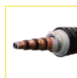
三相同轴超导电缆